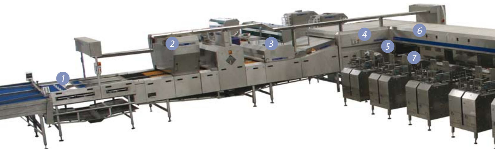
OMNIA FT500 Inline